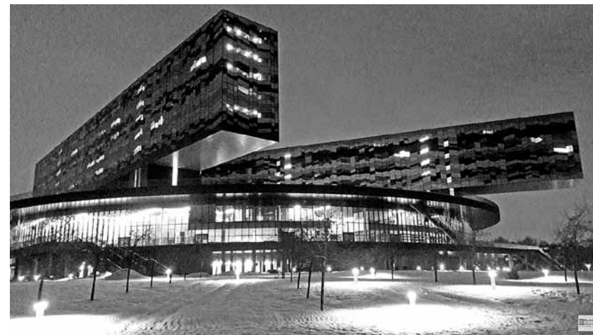
Московская школа управления, Сколково

— В США люди на 80% больше жертвуют, если кто-то удваивает каждый внесенный доллар.