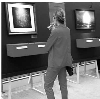
Выставка Целевые капиталы, г. Самара

Вот некоторые глобальные тренды и вызовы: