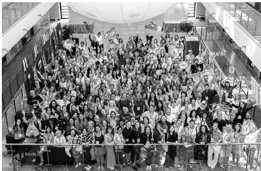
Конференция Белые ночи фандрайзинга, г. Самара

— Становится меньше доноров, но возрастают суммы, тоже характерно для грантов, идет тотальная консолидация ресурсов и возникают matching программы между компаниями и фондами.