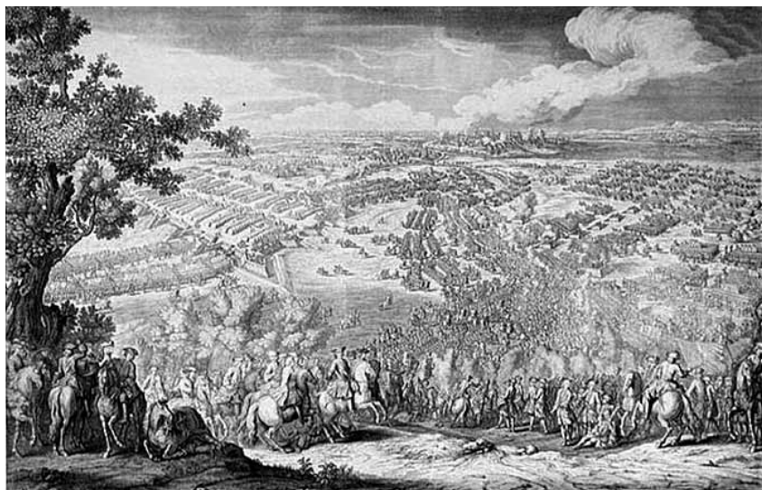
Г-358 КМИИ КП-1635 Лармессен Н. Полтавская баталия