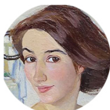
Зинаида Евгеньевна Серебрякова