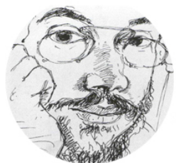
Александр Николаевич Бенуа