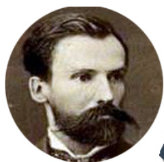
Евгений Александрович Лансере